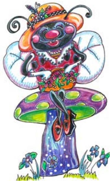
BAN004 - Sittin Pretty