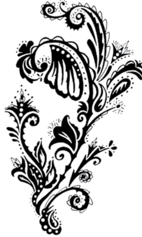
BAN006 - Butterfly Floral