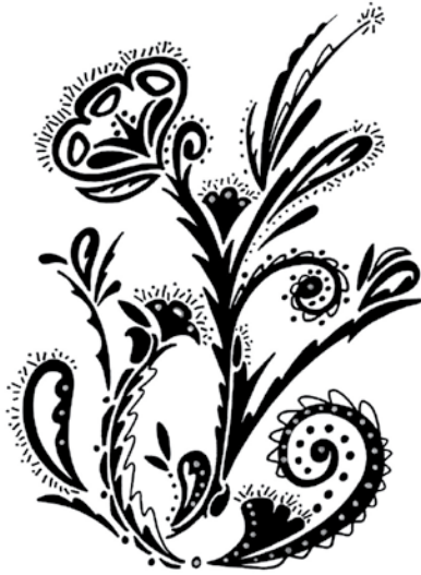
BAN005 - Spring Blooms