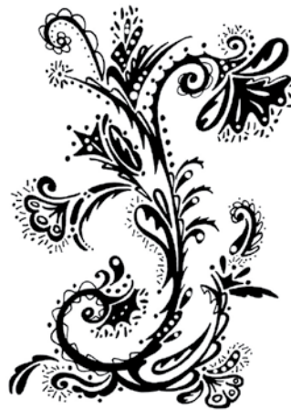
BAN009 - Bashful Blooms