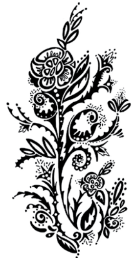
BAN010 - Pretty Poppies