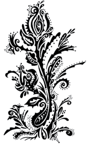
BAN007 - Pasley Posies