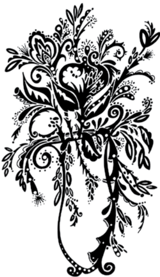
BAN008 - Artful Arrangement