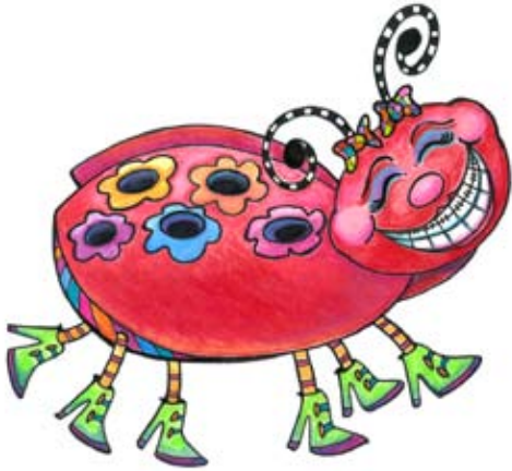
BAN001 - Lil' Lady