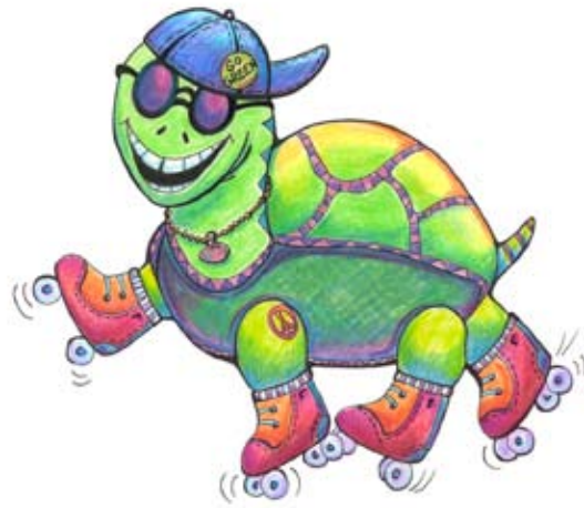
BAN002 - Rollin Reptile