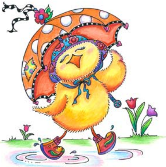
BAN003 - Just Ducky