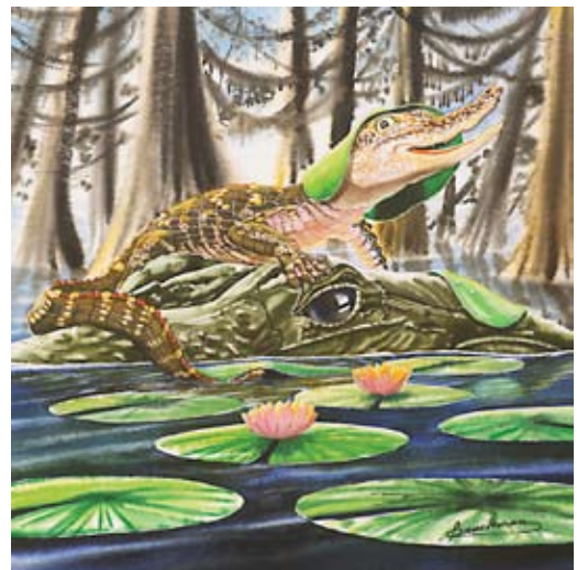
BAU010 - Isabelle