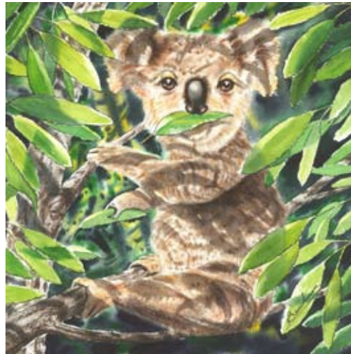
BAU004 - Theo