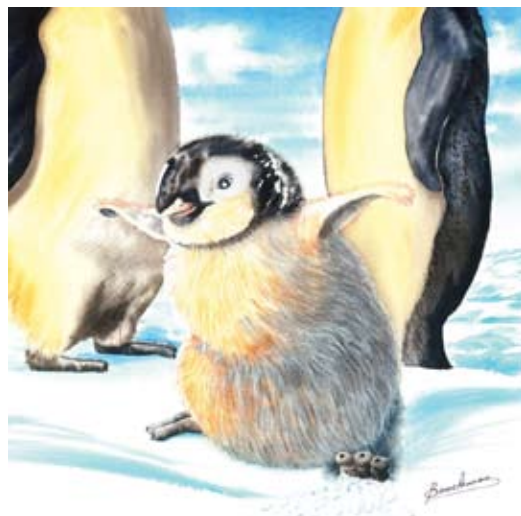
BAU006 - Charlie