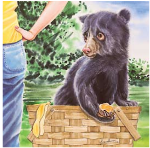
BAU008 - Claude