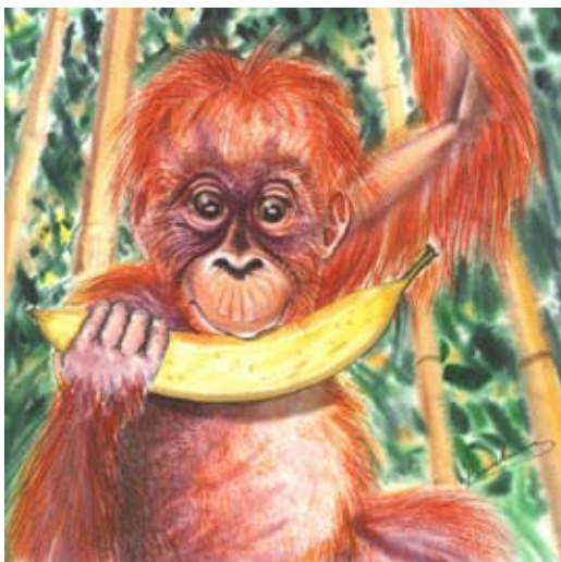
BAU005 - Manny