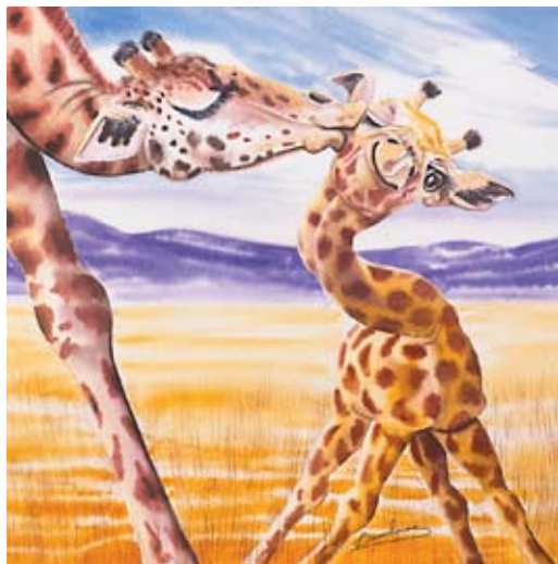
BAU009 - Gracie