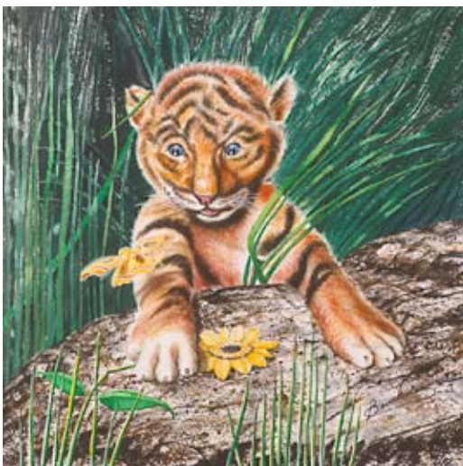
BAU011 - Rufus