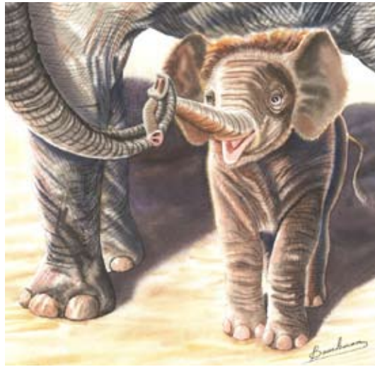
BAU002 - Chloe