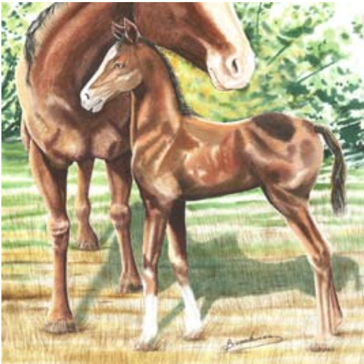
BAU003 - Socks