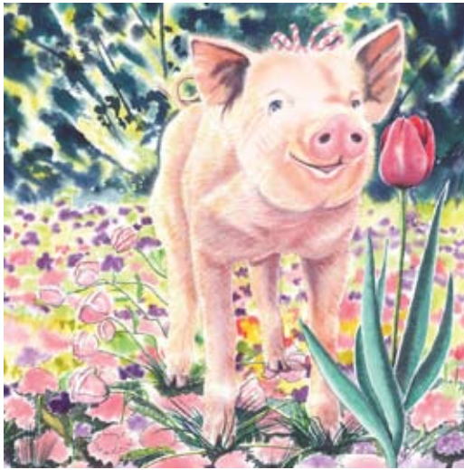
BAU007 - Tulip