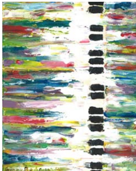
BOD013 - Piano