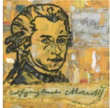
BOD012 - Mozart