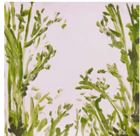
BOD006 - Green Glory III