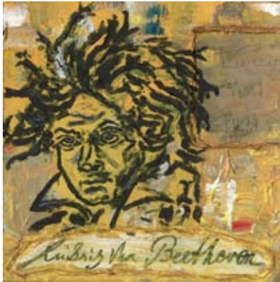
BOD010 - Beethoven