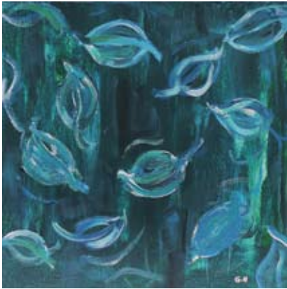
BOD007 - Blue Glory I