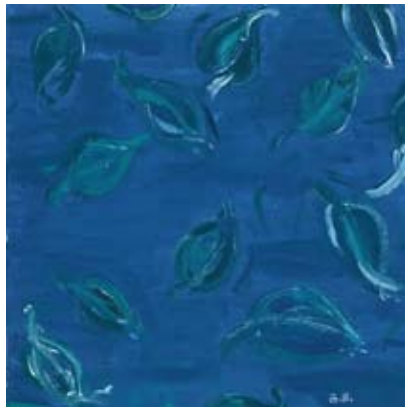
BOD008 - Blue Glory II