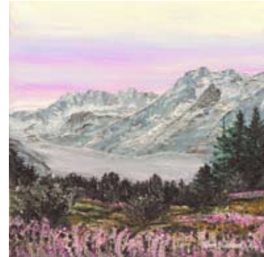
BOD003 - Snowy Mountains