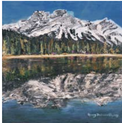
BOD002 - Blue Sky Mountain