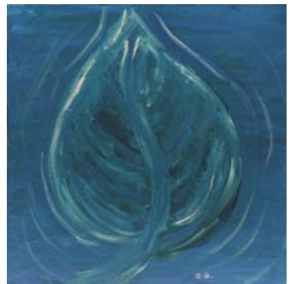
BOD009 - Blue Glory III