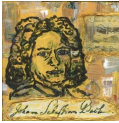
BOD011 - Bach