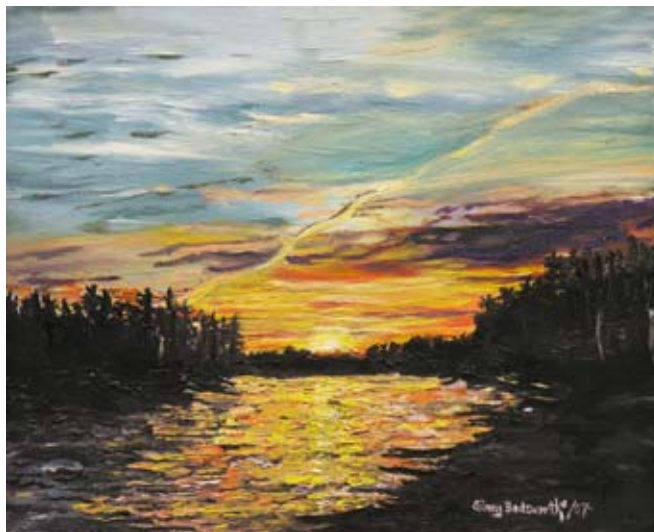
BOD004 - Night Sky