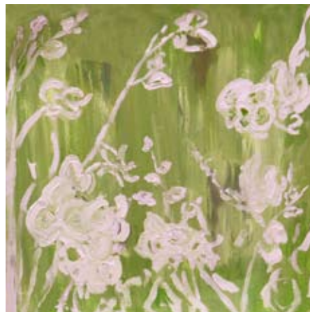
BOD005A - Green Glory II