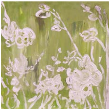
BOD005 - Green Glory