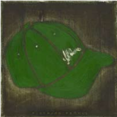
FER014 - Green Hat