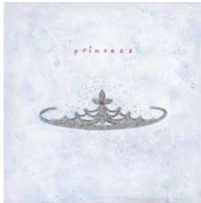
FER003 - Princess