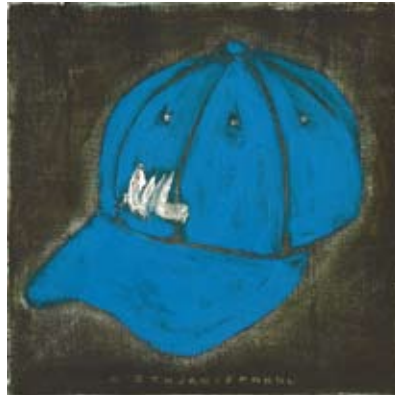
FER015 - Blue Hat