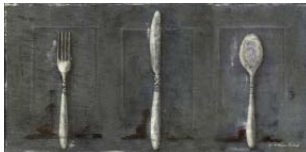
FER020 - Silverware