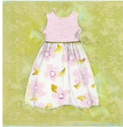
FER002 - Pink Dress w/ Pink Flowers