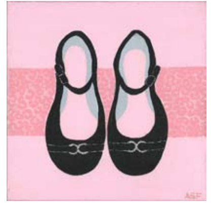
FER013 - Proper