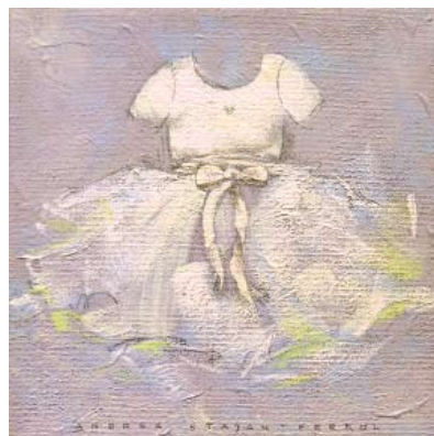
FER009 - Ballerina's Dress