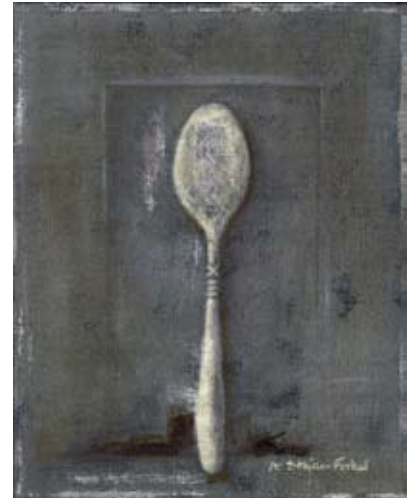
FER019 - Spoon