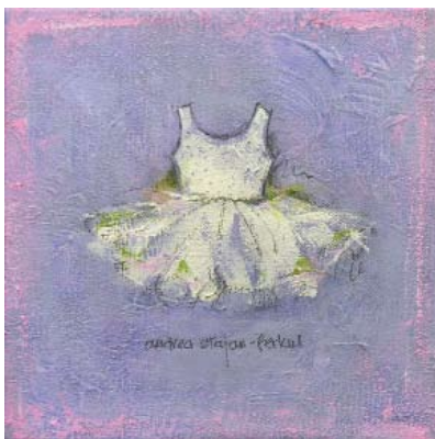
FER005 - White Ballerina Dress