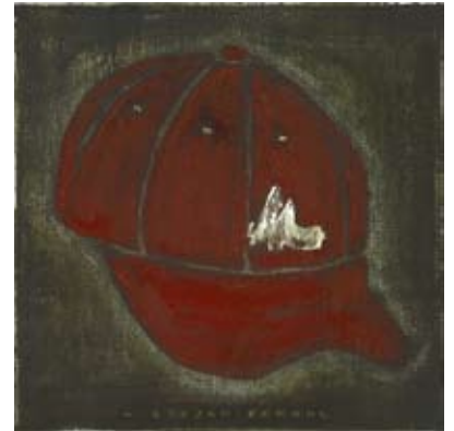
FER016 - Red Hat