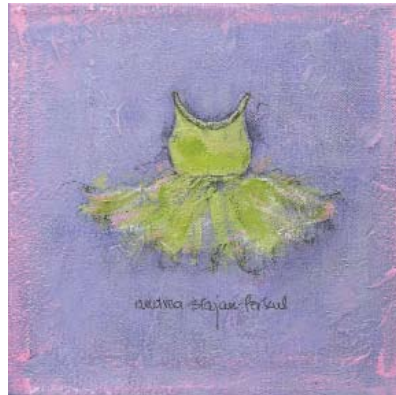
FER006 - Green Ballerina Dress