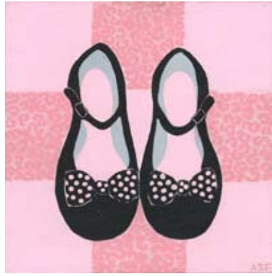
FER012 - Prim