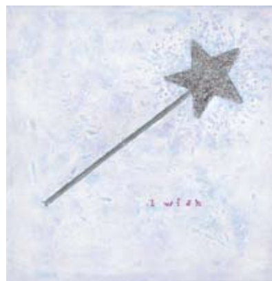
FER004 - I Wish