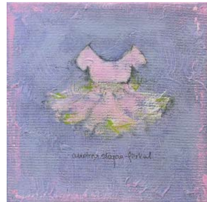
FER007 - Pink Ballerina Dress