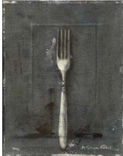
FER018 - Fork