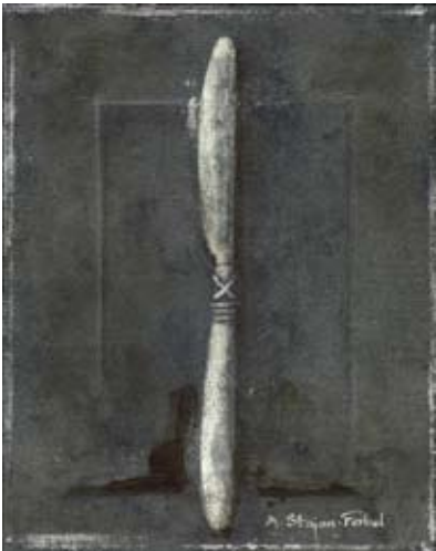
FER017 - Knife