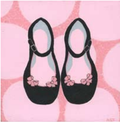
FER011 - Pretty