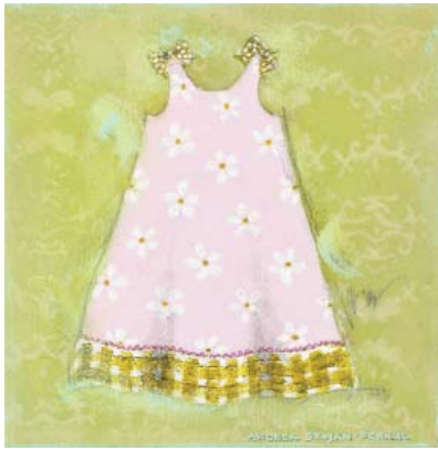
FER001 - Pink Dress w/ White Flowers