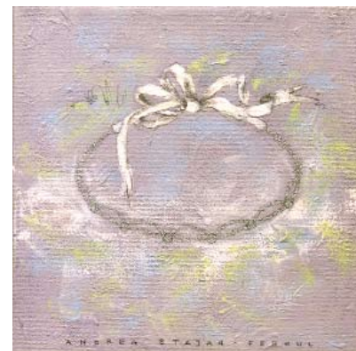
FER010 - Ballerina's Crown