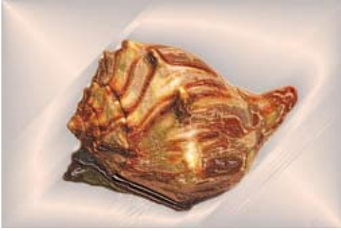
GAB367-Sea Shells 07