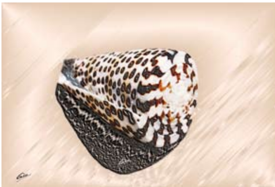
GAB375-Sea Shells 17