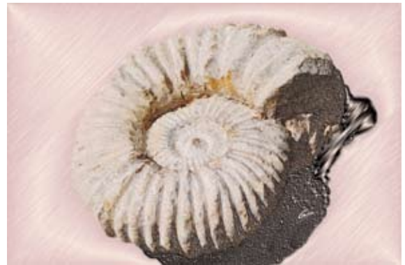
GAB374-Sea Shells 16