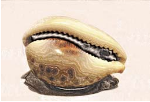
GAB363-Sea Shells 01