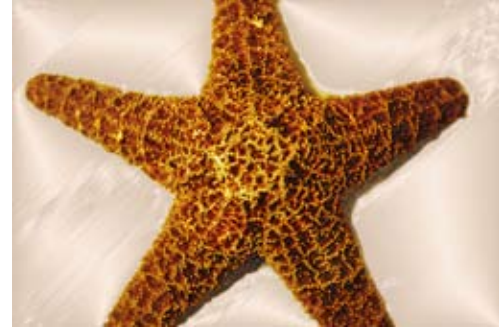
GAB368-Sea Shells 08