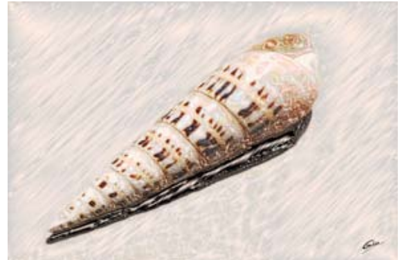
GAB377-Sea Shells 19