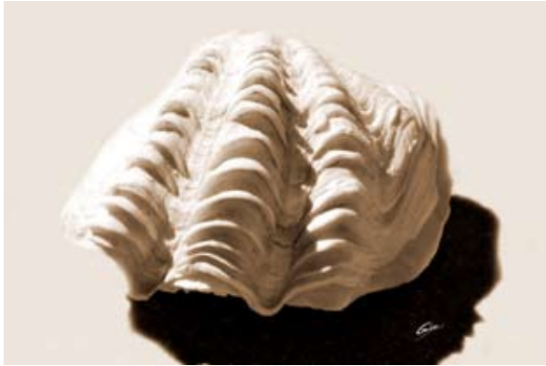
GAB372-Sea Shells 13