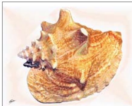
GAB379-Sea Shells 22