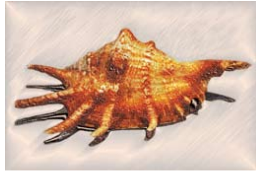
GAB365-Sea Shells 04