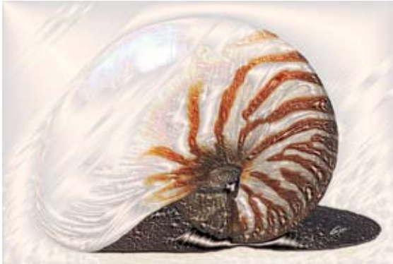
GAB373-Sea Shells 15