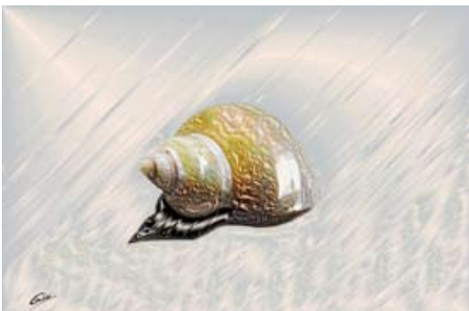
GAB378-Sea Shells 20