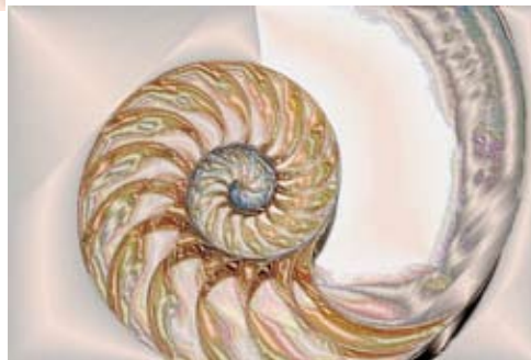
GAB370-Sea Shells 12