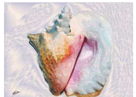
GAB380-Sea Shells 23