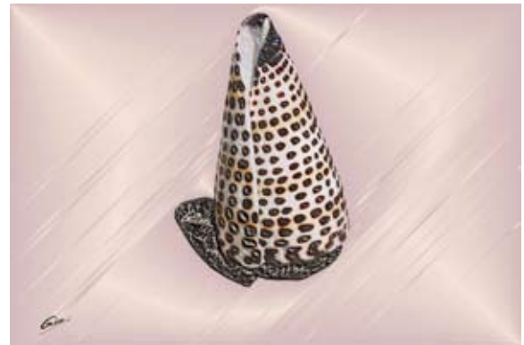
GAB376-Sea Shells 18