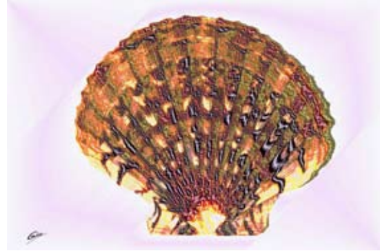
GAB364-Sea Shells 03