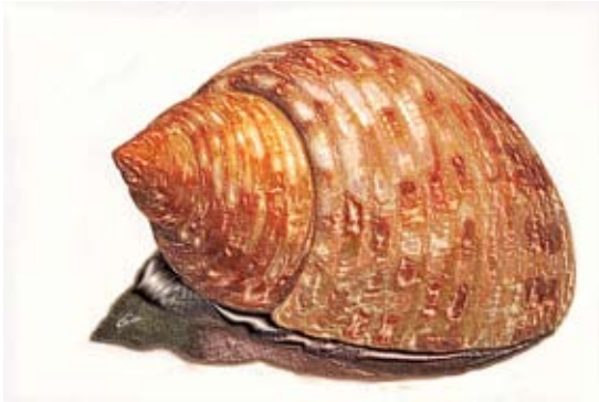
GAB366-Sea Shells 06